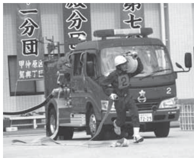
昨年の粕屋町消防団ポンプ操法大会

※当日は中部消防署庁舎において、消防車・救急車の見学、記念撮影会などのイベントも予定しています。