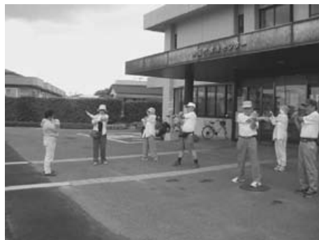
▲出発前の準備体操の風景 毎回20名程度の参加があります。

普段運動不足を感じている方、健康診断で肥満や高血圧などの指摘を受けた方、ウォーキングを始めてみませんか。にこにこペースで歩くことは健康づくりの第1歩です。