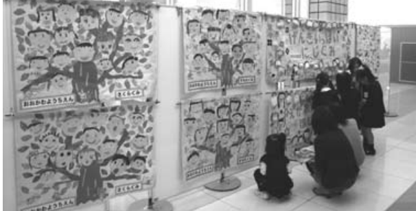
昨年の子どもの笑顔のポスター展示風景

午前中の式典では、子どもたちがお世話になっているボランティアさんの活動紹介や、子どもたち作成の子ども笑顔のポスター展示などを計画しています。午後からは、サンレイクかすや館内において、遊びのコーナーやフリーマーケットなどを企画しており、さくらホールでは保育士などによるステージ発表が行われる予定です。多くの皆様のご来場をお待ちしております。