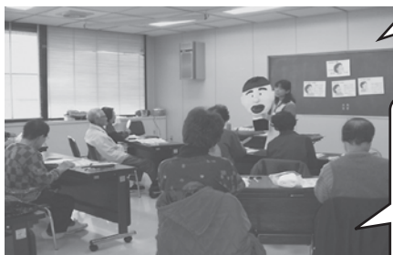
「かすやお口から元気教室」