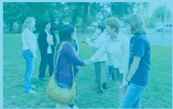
▲第10回「青少年の翼」交流会風景

東北地方太平洋沖地震 ～午後5時まで 土・日・祝・祭日を除く 資格 中学生から20歳まで 班長 21歳から35歳まで 団員 粕屋町在住で、平成3年4月22日から平成11年4月1日までに生まれたい人。 健康 協働性に富み、研修計画に沿った規律ある団体行動に耐えられる人。 目的意識を持って、研修に参加できる人。 ●事前 事後研修に参加できない人。 ※申込みが定員を超えた場合は抽選で決定します。 ●班長 粕屋町在住で、昭和51年4月2日から平成3年4月1日までに生まれたい人。 ◇研修の企画などを行う班長会議に出席し、各班の団員をまとめることができる人。 ◇過去に粕屋町又は県などの青少年の船一翼などに参加した経験のある人。 ※面接を実施します。 ◇提出書類 ◇参加申込書 ◇団員応募承諾書 ◇応募動機(400字詰め原稿用紙1枚程度) 中止