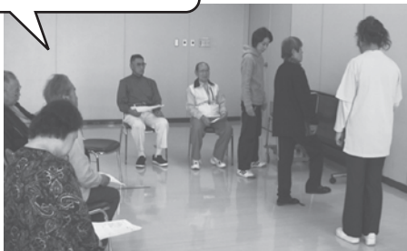
「かすや貯筋体操ひろば」