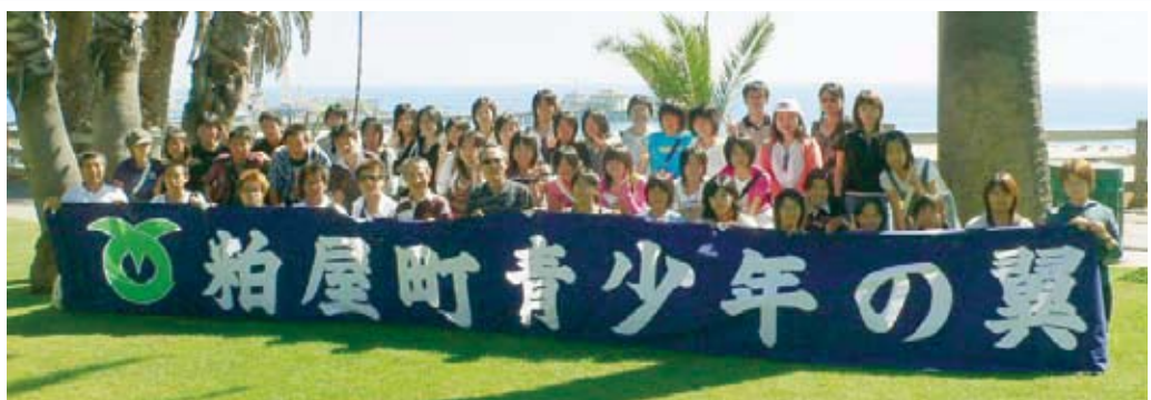
▲第10回「青少年の翼」集合写真

●申込み・問い合わせ 粕屋町教育委員会社会教育課 ☎0938-11410 粕屋町鷹与二丁目1-1 (粕屋町役場の隣)