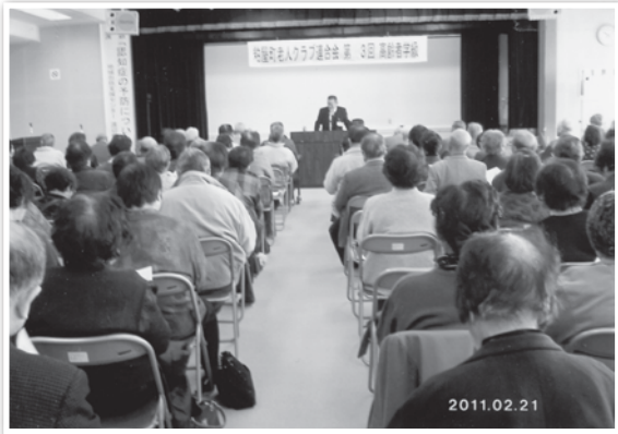
八尋課長補佐のお話