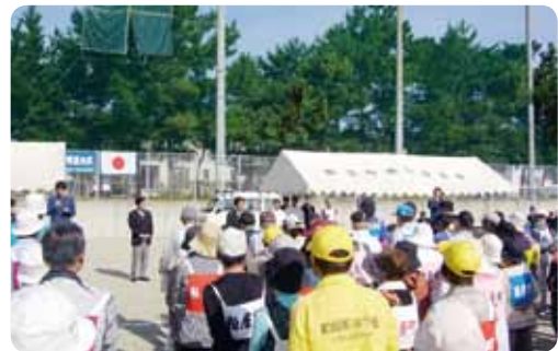
大会に向けて心が弾み始めます

気温も上昇し汗をかきなが らも、一生懸命に身体を動か して頑張っておられる姿に、 勇気と元気をもらいました。 競技が終了後、結果の発表 があり、ホールインワンの多 さに驚きました。参加者の中 には90歳の男性がおられたこ とを知り、感動しました。 大会は和やかなうちに無事