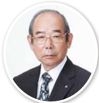
因 清範 氏