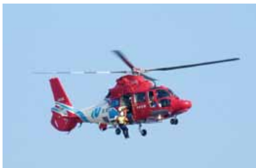
ヘリによる上空からの要救助者救出

今年度の九州ブロック訓練は、11月5日(土)～6日(日)の2日間、長崎県雲仙市多比良港埋立地をメイン会場に、長崎県島原半島に存在する雲仙地溝北縁断層帯を震源とするマグニチュード7.3の地震等が発生し、長崎県内において大規模災害が発生した事を想定し実施され、当本部から特別救助小隊、後方支援小隊合わせて7名の隊員が参加しております。