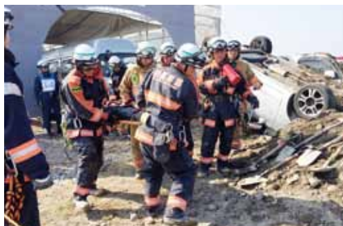
トンネル崩壊多数傷病者救出訓練