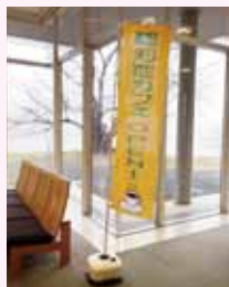
「認知症カフェ」の 旗が目印です。

参加者 13名（スタッフも含む） お話し以外にも童謡やわらべ歌 で楽しみました。直接認知症の 方とふれあうことで日々の家族 の介護を見直す機会になったと いう感想がありました。