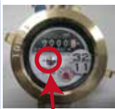
この銀色のコマをみてください

上記以外にも、指定工事店がありますので、粕屋町上下水道課までお問い合わせください。