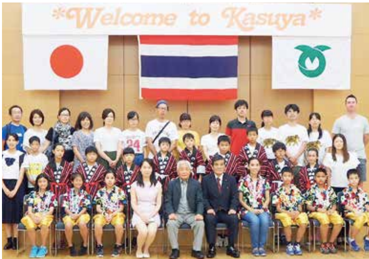
昨年のウェルカムパーティーの様子。タイから子ども大使を受け入れました。