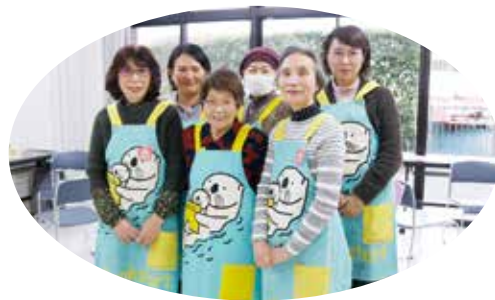
▲「まーぶる」の皆さん

絵本の読み聞かせを通じて、親子のふれあいや絆づくりを推進しています。10か月児健診でのブックスタートで絵本の読み聞かせを行っており、わっしょいフェスタではブックスタート活動の紹介をしています。かすやこども館でのイベントの協力もしています。