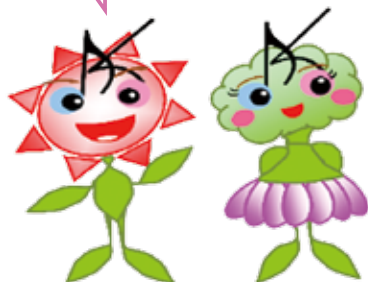
健康かすや21イメージキャラクター ゆたかくん こころちゃん

粕屋町の健康づくりの計画です。食生活や運動、たばこ・アルコール、こころの健康などの6つの分野を中心に健康づくり活動を進めています。