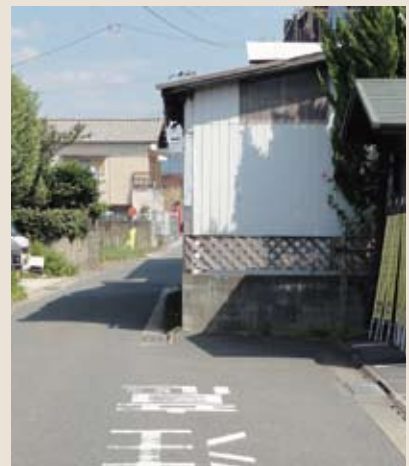
道路改良工事予定地

JR原町駅前通りの若宮・平原線の道路改良工事の予算がつきました。 工事内容は建物の一部を買収して道路拡幅工事を行うものです。