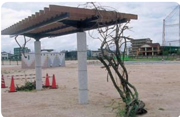
阿恵大池の枯れた藤ダナ

また、管理につきま しては、近隣の方の地 域ボランティアで管理 していきたいと考えま す。