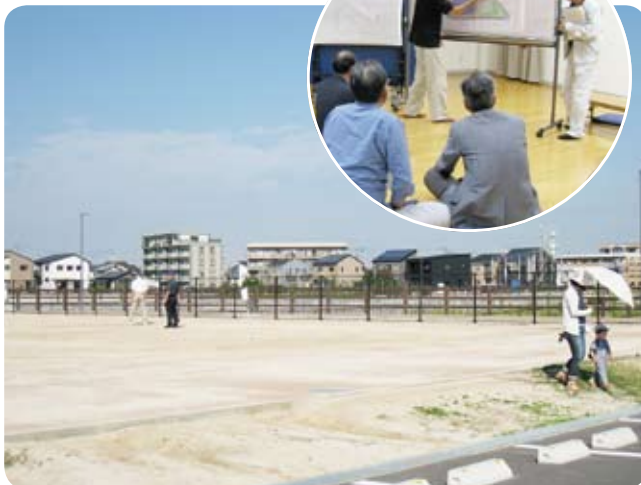
阿恵大池公園と9月24日の住民説明会