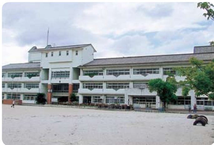
粕屋町立中央小学校

連を調査する意向であ ります。 抽出校による全国学 力調査結果では、全国 平均に比べ粕屋町は若 干上回った結果が出て います。