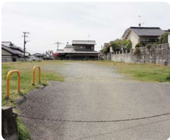
町有地の長者原上区葛葉地区