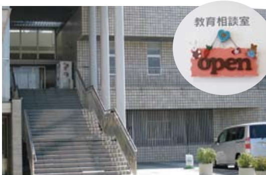
教育相談室はサンレイク階段右奥です

学校生活における児童生徒の「問題行動」を未然に防止するために、生徒指導の充実を図り、相談体制の整備と学校・家庭及び地域の連携に努めています。