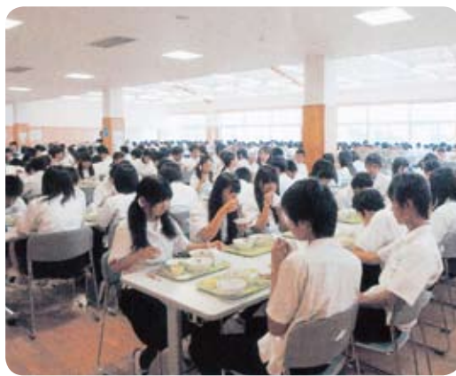
津屋崎中学校の給食室スカイルーム