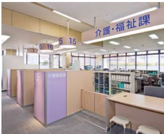
介護・福祉課窓口

審査会は保健、医療、福祉の学識経験者の5名の委員で構成しており、不服申し立ては変更申請をしてもらい再度審査します。福岡県介護保険審査会へ不服申し立てた人は過去にいませんでした。