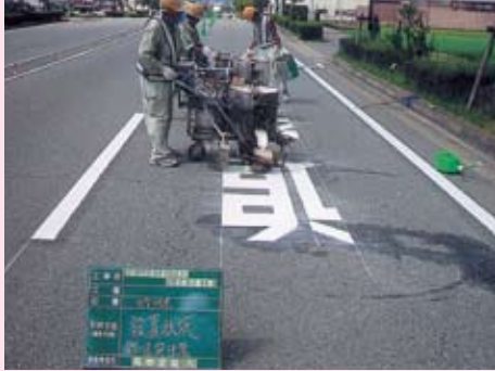
通学路の路面表示