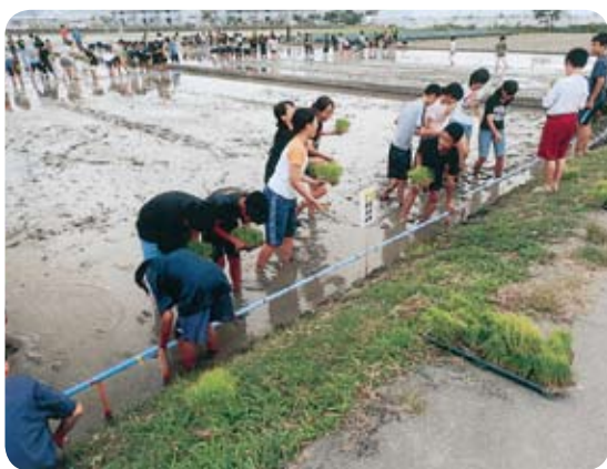
みんなで仲よく田植え作業

文部科学省が来年度から全中学にスクールカウンセラーを配置するなど新聞報道がありますが、第3者機関の設置など状況を見ながら準備、検討させていただきます。