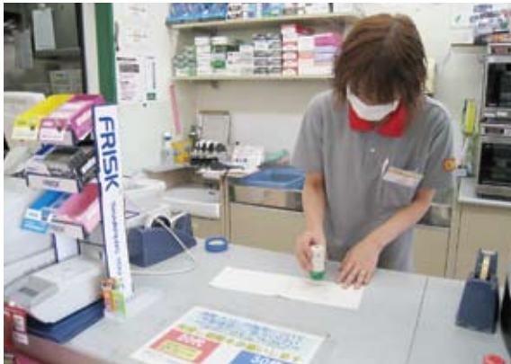
増えているコンビニ収納

平成22年度の機構改革で収納課を創設し、県外滞納者の徴収分が増加しました。23年度は部、課を超え「粕屋町債権管理収納連絡会議」を立ち上げ、収納課と関係各課との連携による徴収体制の確立に取り組んでいます。しかしながら近隣の自治体との比較ではまだまだ不十分です。今後、も公平性から収納率向上に努めます。