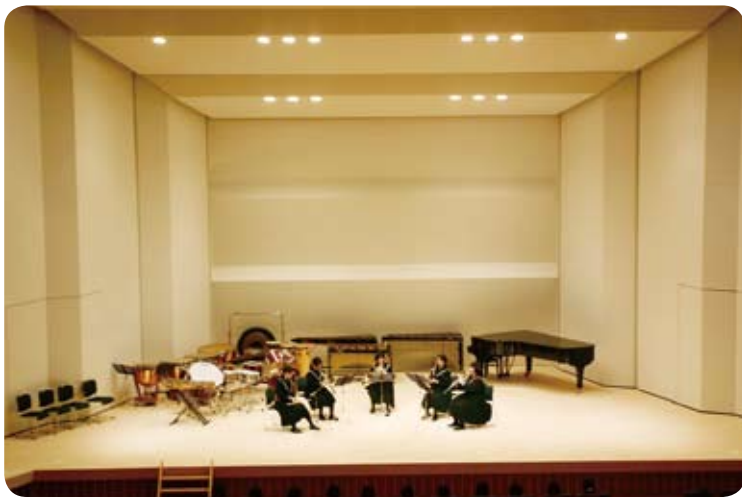
実演芸術に参加している生徒