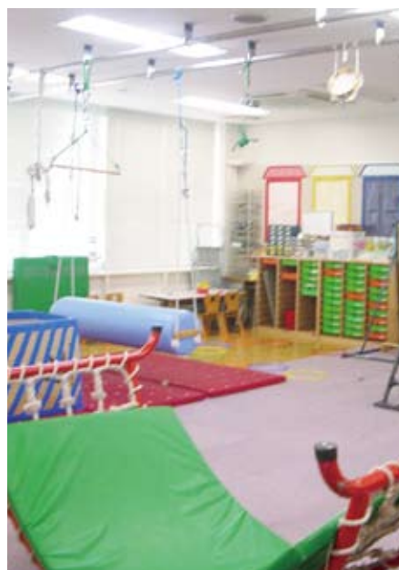
健康センター療育指導室

町立保育所や幼稚園は療育支援係が相談を受け付け、民間は、園の先生を通じて対象者に郵送をして、療育を受けるように案内しています。また、5歳の入学前のアンケート調査をして掌握しています。