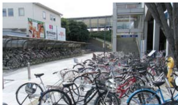
長者原駅南側の駐輪状況

JR各駅の駐輪場施設等の点検及び、駐輪スペースの有効利用を図るため放置自転車の移動、撤去を実施しました。年5回実施し、302台の放置自転車を回収、回収した自転車は防犯登録の照合、告示を行い44台所有者への引渡しし258台廃棄処分を行いました。警告書を貼り、放置後2週間過ぎても移動がなければ、役場で保管して3ヶ月後に廃棄処分を行います。