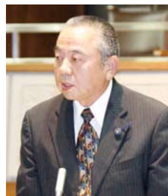
久我 純治 議員