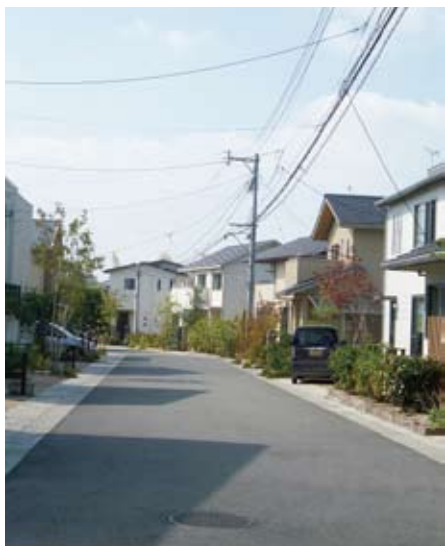
定住者が増えている駕与丁北部地域

粕屋町は転入転出者の入れ替りが多い町です。子育てが終わり定住できる町づくりを考えた政策が必要であると議会で議論され、その一つとして住宅建設に伴う建ぺい率、容積率の緩和があります。今後、福岡都市計画の用途地域の見直しを求めていきます。