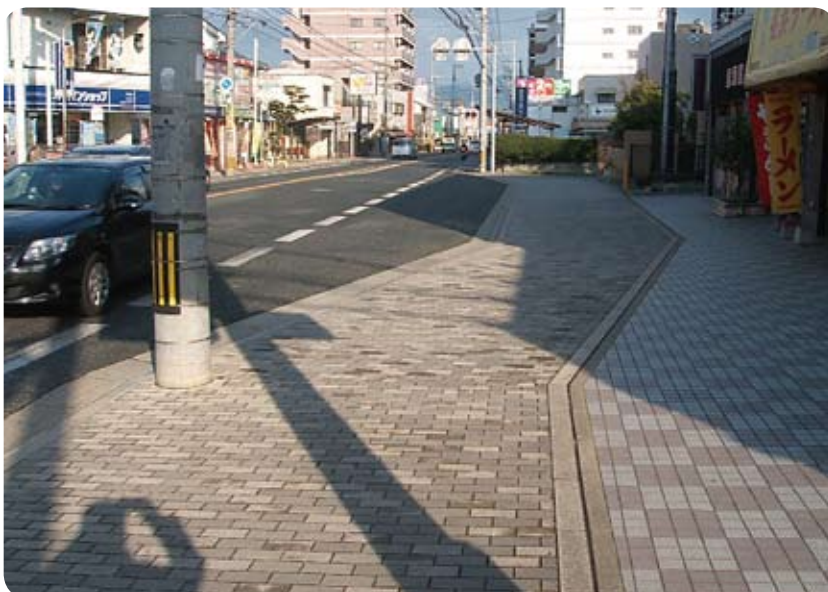
原町バス停の風景