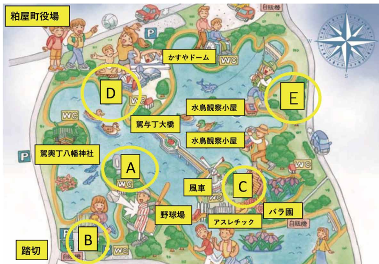
あなたにとっての魅力的な場所は

公園利用の動機にもなるお店、利用される町民の皆さんからのご提案を吸い上げる場を今後議会でも設定していければと考えています。