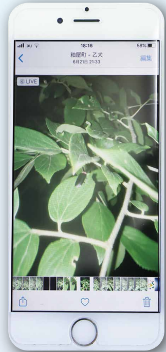
粕屋町-乙犬(篠栗町) 6月21日 21時33分

表紙の場所は、粕屋の小学生も訪問したりすること。江戸時代の ちょうへい 長卯平氏などの功績で知られる若杉山溪流水の分流の要となる新大間池への取水口となる場所でもあります。