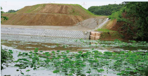
2020年6月22日に撮影した現地

結局私はこの多々良川で せき 蛍を発見することができませんでした。しかし、この行動で集めた情報からある場所の せき 蛍生息情報を入手しました。その現地へ行くと粕屋町の方、須恵町の方、篠栗町の事業所で働く若者から目撃情報をいただき、 にっさん 現地へ日参することとなりました。7回目の夜に撮影したのが右の写真です。