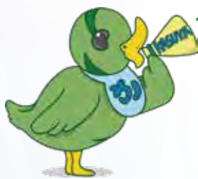
粕屋町議会 イメージキャラクター 「かすかも」