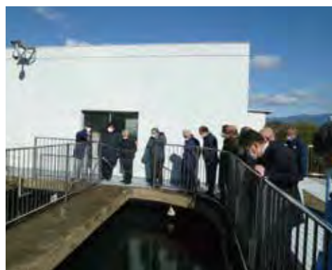
牛頸浄水場(大野城市)