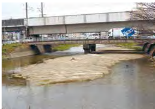
須恵川(福岡市松田新幹線下)の土砂の堆積

都市政策部長 今後取り組むべき治水対策の全体像を「流域プロジェクト」として策定、公表し、流域治水の取り組みが推進されています。 福岡県においても、今年度から二級河川を対象に県内を四つの圏域に分けて