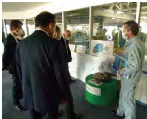
海の中道奈多海水淡水化センター(福岡市東区)