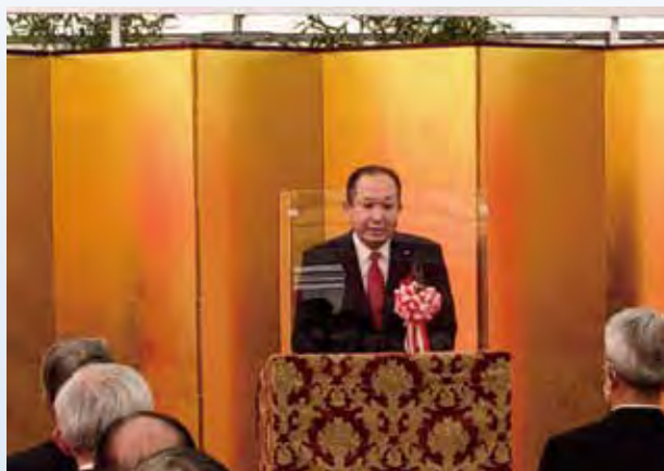
小池議長のあいさつ