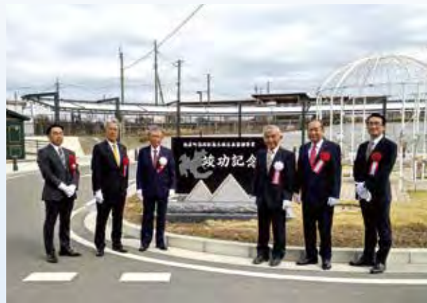
酒殿駅前には記念碑が建てられました