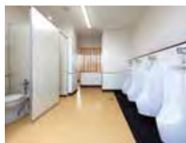
洋式化された中学校のトイレ