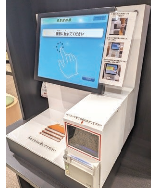
セルフ式自動貸出機 (他自治体導入事例)