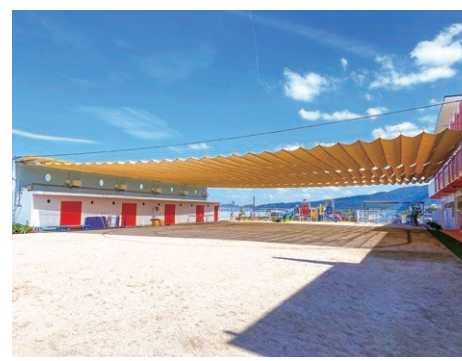
他自治体の園庭日除けネット施工事例