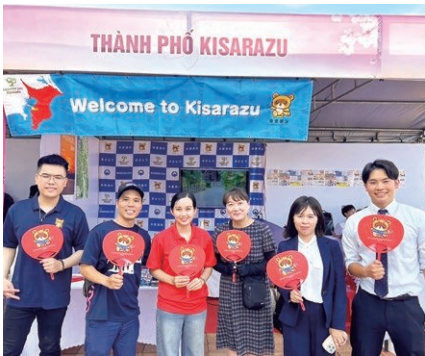
ダナン国際フェスティバル自治体PRブース

国、県あるいは民間への国内派遣を今は検討している。職員の海外派遣も含め一足飛びに国外という様々なハードルがある。