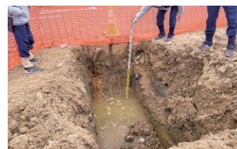
朝日団地で確認された湧水

朝日団地の建替え工事中、敷地内に湧水が確認されたことによる追加工事が発生し、併せて洗面台設備の数量誤りが判明したため、契約が変更されました。