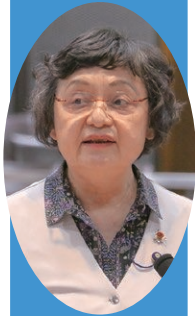
みやざき ひろこ 宮崎 広子 議員