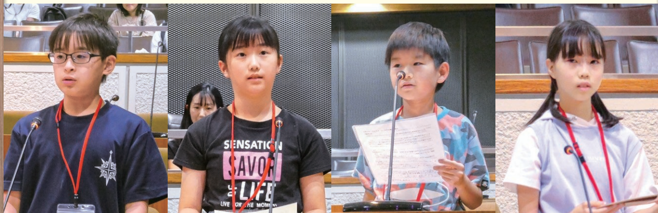
※写真はランダムに配置しています。討論内容と写真は対応していません。