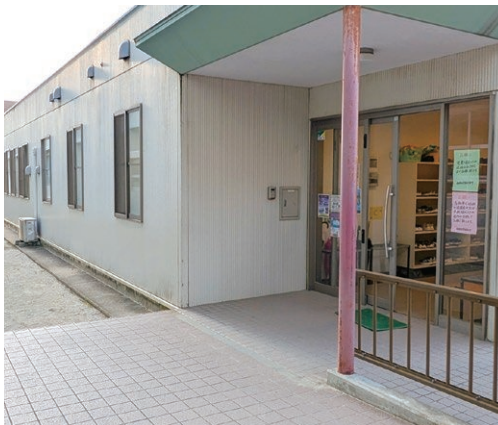
増設により待機児童ゼロの西小学童保育所

県と協議しながらワーキング会議等も開いて打開策を練っている。教育委員会にとどまらず、町当局も連携して真剣に取り組みたい。